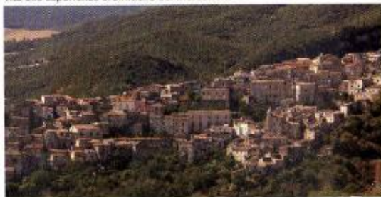
Saracena: Centro storico

Certamente i luoghi montani e le numerose grotte del territorio dell'Alto Sybaris hanno favorito la presenza dei monaci basiliani che da Rossano diedero vita alle esperienze eremitiche del Mercurion.