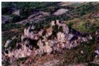
Panoramica della collina di Cittavetere