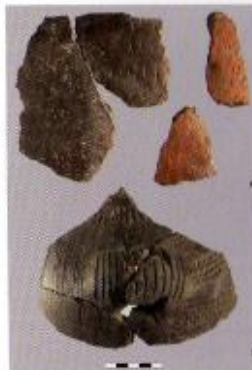
Ceramica impressa del Neolitico antico

Monte Carpanosa: fossili di rettili marino del triassico superiore