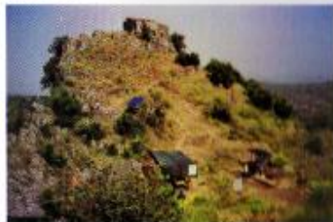
Zona della campagna di scavo del 1999

l'altura su quasi tutti i versanti, sono stati aperti a quote diverse quattro saggi delle dimensioni di 1 x 2 metri. Detti saggi, grazie ad i reperti rinvenuti in giacitura "primaria" (tazze o scodelle dotate di manici, anse a nastro), hanno consentito di stabilire che i materiali sono riferibili all'età del bronzo medio (1800/1700-1400 a.C.)