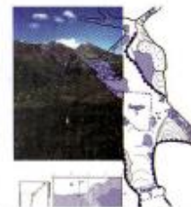
Panoramica e pianimetria della grotta

La breve indagine superficiale compiuta ed un limitatissimo approfondimento al centro della camera principale della grotta permettono subito di stabilire, in base alla diffusa presenza di ceramica figurina talora ornata con decoro dipinto, assegnabile all'età storica arcaica e specificatamente corinzia, di trovarsi di fronte ad un sito utilizzato come santuario degli Achei di Sibari, posto alla frontiera del loro territorio per scopi religiosi ma anche per scambi economici e culturali con gli Enotri che abitavano nella valle del Garga.