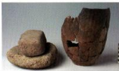
Macina e vaso del neolitico antico