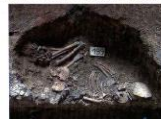
Sepoltura di fanciullo del neolitico

Sotto i resti di una capanna del neolitico recente (4.500 a.C.) è stata rinvenuta la sepoltura di un fanciullo di 4 anni d'età. La Grotta presenta sul fondo una seconda apertura interessata da una imponente frana, avvenuta probabilmente in epoca eneolitica e che ha sigillato preservandola una paleosuperficie dell'età del rame, ricca di reperti della cultura detta "piano Conte".