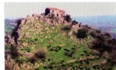
Collina di Città Vetere

Anche se resta ancora da svolgere un cospicuo lavoro di studio del materiale rinvenuto, nel corso delle numerose campagne di scavo effettuate su tale territorio su iniziativa dell'Associazione Sextio, si è tuttavia in grado di affermare che la vallata del fiume Garga rappresenta un luogo straordinario di interesse archeologico dove la presenza dell'uomo si registra ininterrottata da ben 8.000 anni.