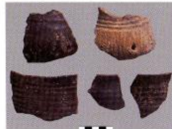
Ceramica dell'età del rame (cultura Piano Conte)

Il sito ha rivelato una delle sequenze stratigrafiche più interessanti della regione, rappresentate da orizzonti culturali compresi tra il neolitico antico (ca. 6.000 a.C.) e la media età del bronzo (ca. 1500 a.C.) che pongono la Grotta di S. Michele come nuovo sito-chiave per l'analisi delle culture preistoriche di età neo-eneolitica dell'area tirrenica meridionale.