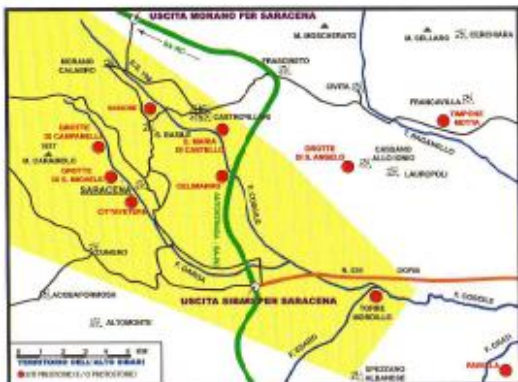
Il territorio dell'Alto Sybaris